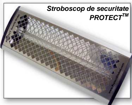
Stroboscop de securitate PROTECT™

Stroboscopul de securitate PROTECT™ este o sursă de lumină pulsatorie de capacitate mare (4-6 flash-uri / secundă), foarte deranjantă.