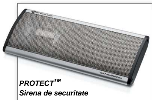
PROTECT™ Sirena de securitate

Rolul sirenei de capacitate mare este pe lângă atragerea atenției mediului înconjurător și descurajarea infractorilor.