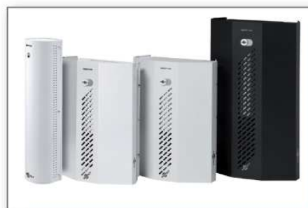
Tunurile de ceață PROTECT™

PROTECT A/S a lansat tunurile de ceață seria „i” în anul 2012, având capacități mult mai mari față de modelele anterioare. Modelul anterior PROTECT 600™ genera 600 m 3 de ceață în 60 de secunde, în timp ce modelul nou PROTECT 600i™, cu funcția TURBO, poate genera acest volum de ceață în numai 30 de secunde. PROTECT 2200i™ este în momentul de față cel mai puternic tun de ceață din lume, în 70 de secunde umple cu 2.875 m 3 de ceață depozitele și spațiile de dimensiuni foarte mari.