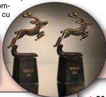
Premiile Børsen Gazelle

Menționând doar țările vecine, aproape în fiecare an, atât producătorul cât și produsele au fost premiate. ▶ 2008. Premiul pentru compania de securitate a anului, Italia. ▶ 2011. Premiul pentru compania de securitate a anului, Danemarca.